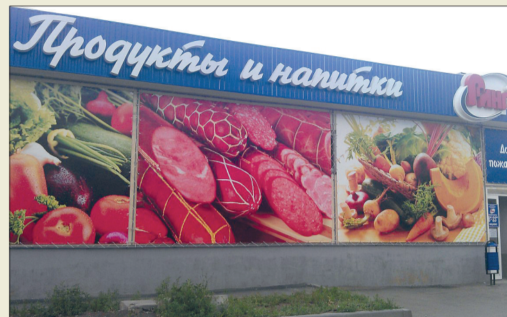
Супермаркет на улице Крайней, 38 открыт для посетителей

Два новых адреса на карте нашего города стали еще одним местом присутствия Компании на рынке. Магазины на улице Крайней, 38 и Орскому проспекту, 27А совсем недавно распахнули двери перед покупателями, но уже успели в очередной раз доказать, что горожане ценят преимущество покупок в торговой сети «Ринг».